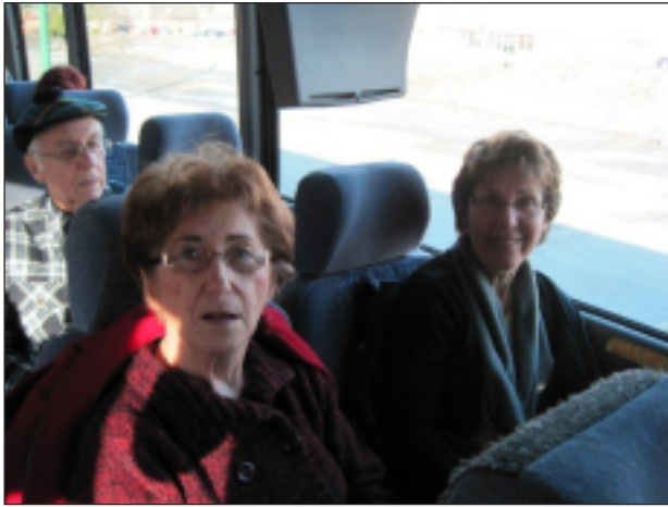
Le Jour de la Terre - 22 avril - La Tuque