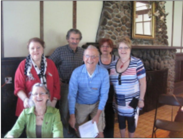
Assemblée générale sectorielle - 28 mai