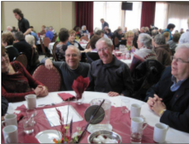
Le dîner des bénévoles - 25 avril