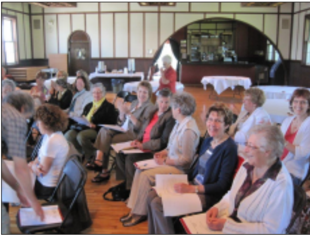
Assemblée générale régionale - 30 mai