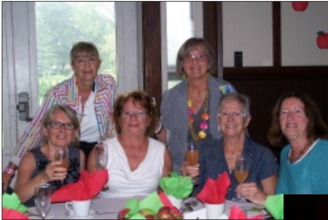
On se retrouve...