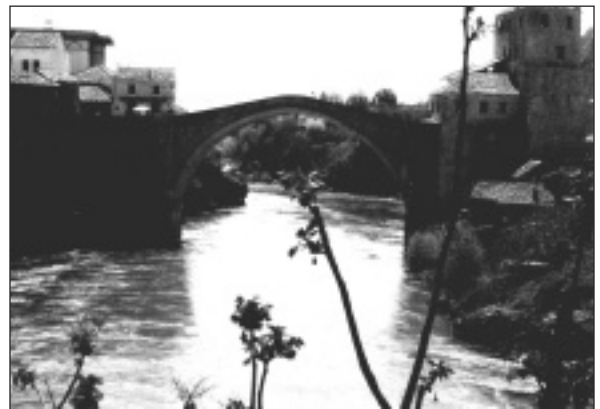
Pont de Mostar