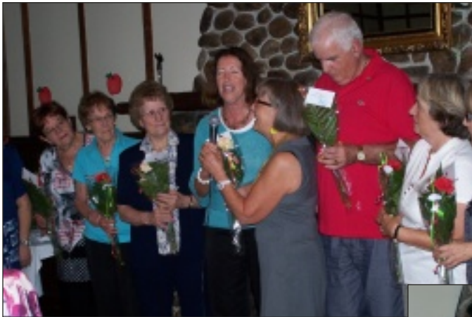
Bonne fête à vous !