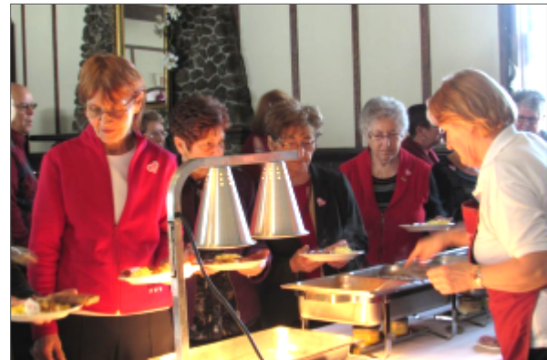
Allons à la cabane !