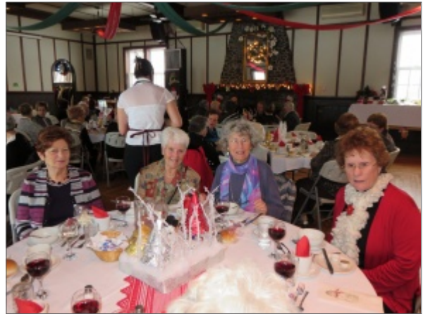
on soutient... la Maison le FAR