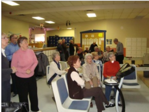
À l'AREQ... on s'amuse