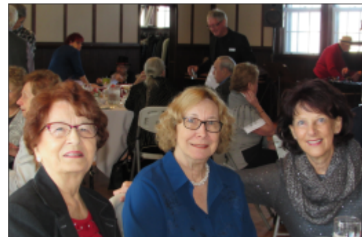
Dîner de Noël 12 décembre