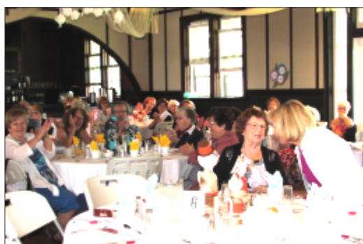
Brunch des Retrouvailles Septembre 2018