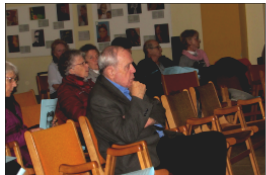
Messe souvenir Chapelle de la Paix