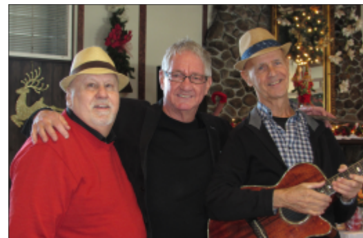
Dîner de Noël 12 décembre