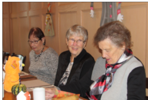
Déjeuner mensuel d'octobre