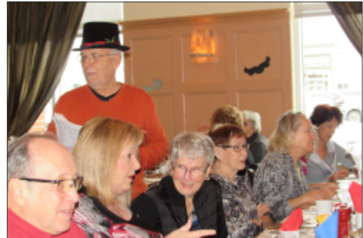
Déjeuner mensuel de novembre