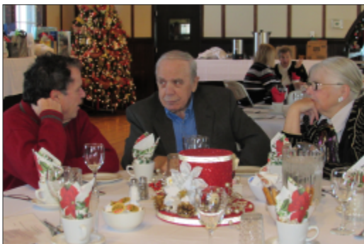
Dîner de Noël 12 décembre