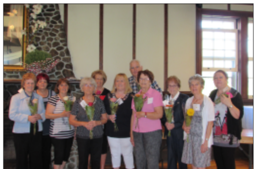
Anniversaires Brunch des Retrouvailles Septembre 2018