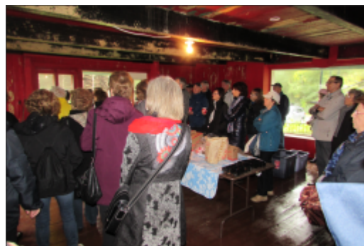
Voyage à La Tuque Domaine McCormick