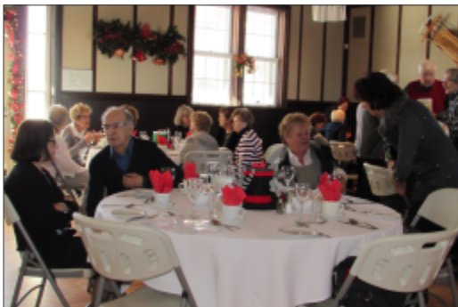
Dîner de Noël 12 décembre