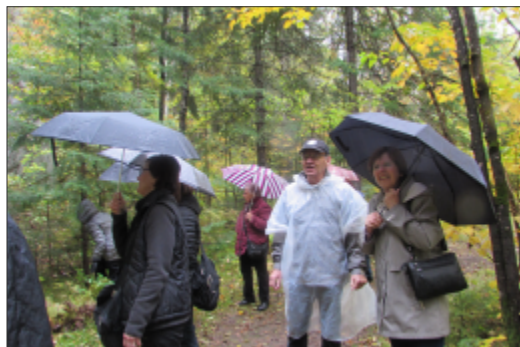
Voyage à La Tuque sous la pluie