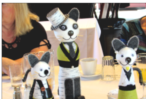
Centre de table Brunch des Retrouvailles Septembre 2018