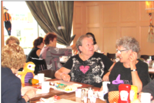
Déjeuner mensuel d'octobre Visite de France