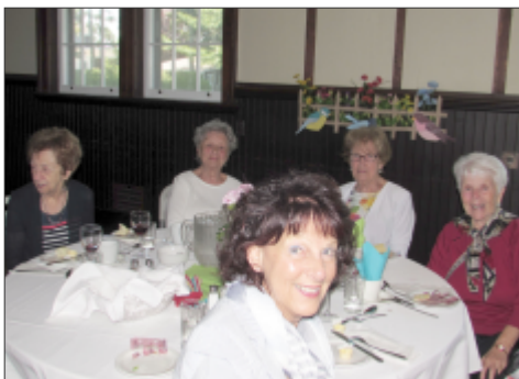
Dîner de fin d'année 2019-06-05