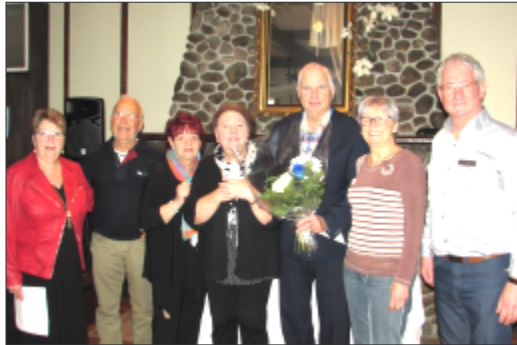
Brunch des bénévoles 2019-04-18