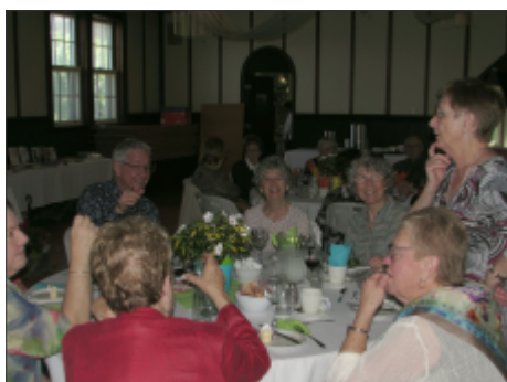
Dîner de fin d'année 2019-06-05