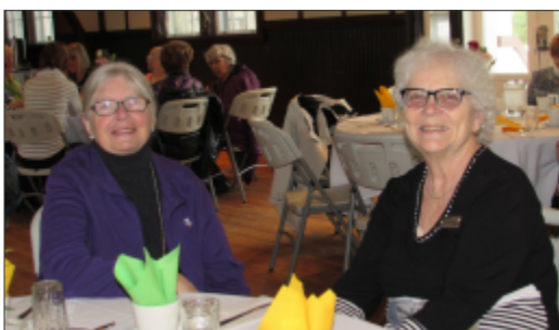
Brunch des bénévoles 2019-04-18