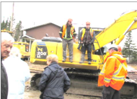
Jour de la Terre 2019-04-24